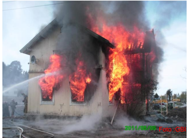
Fra RD-øvelse Kongsvinger i mai

Avdelingen har i 2011 økt antallet på kurs og øvelser. Totalt deltok ca. 1430 personer på kurs i vår regi.