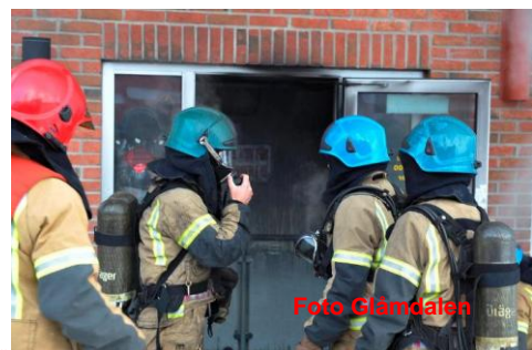
Klar til RD – innsats

Da begge kommuner har bevilget midler for 2012 til GBI betegnes det som at de ønsker å opprettholde selskapet.