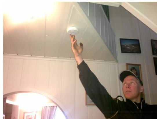
Fra et boligtilsyn i 2011