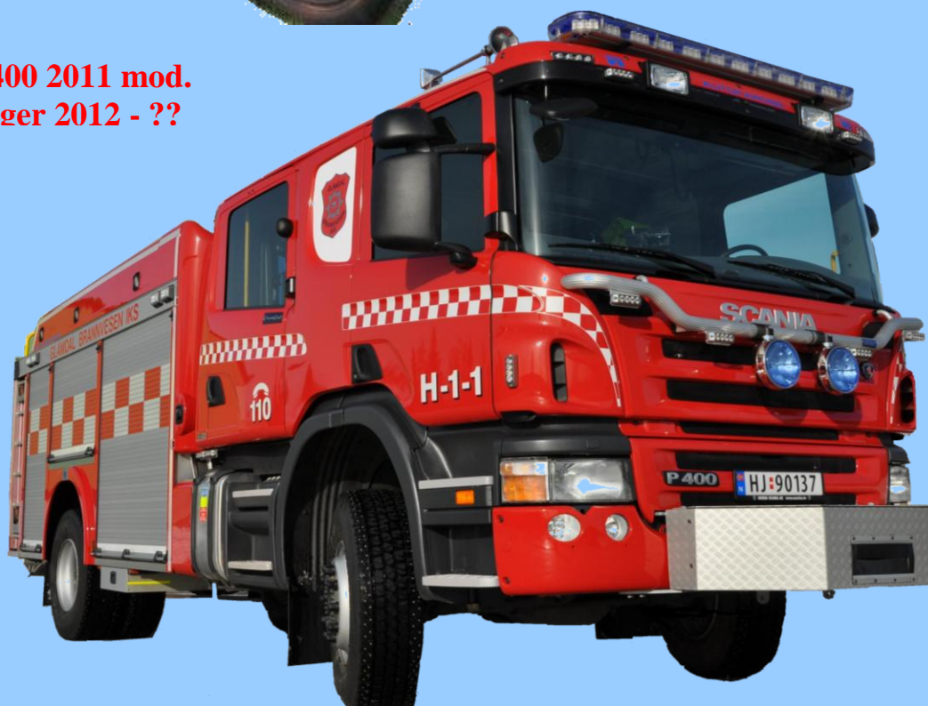
Scania P400 2011 mod. Kongsvinger 2012 - ??