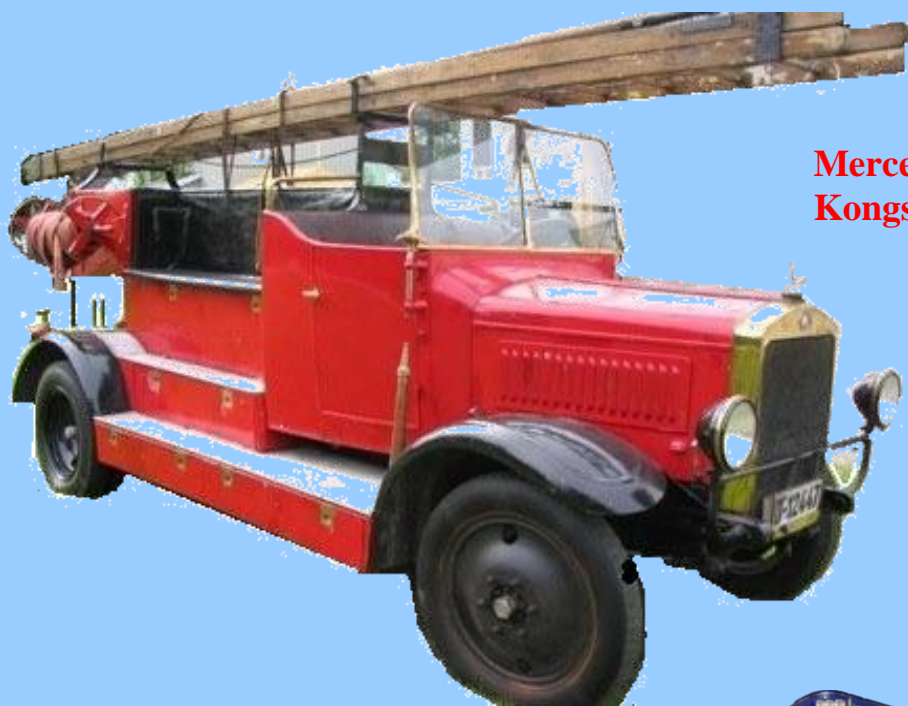
Mercedes 1929 mod. Kongsvinger 1931 - 1963