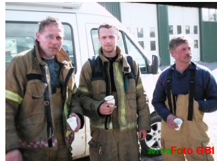
Slitne røykdykkere etter endt innsatsøvelse.

En gang i året utføres det fysiske tester av samtlige mannskap og befal på Kirkenær og Kongsvinger stasjon. I tillegg er det helseundersøkelse av disse. Dette utføres av vår bedriftslege.