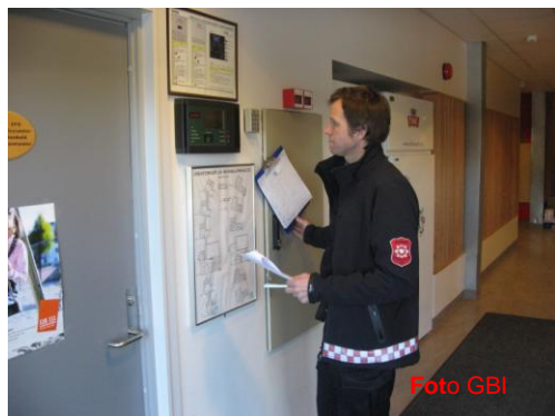
Tilsyn i særskilt brannobjekt

Begge inspektørene er også med i beredskapstyrken som deltidsmannskap. Samt at en er med i en brannetterforskningsgruppe bestående av politi, el-tilsyn og brann.