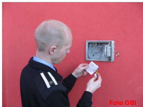
Kontroll / sjekk nøkkelsafe

Det ble i 2011 avholdt 1 brannvernlederkurs. Det er avholdt 2 grunnkurs og 3 resertifiseringskurs i varme arbeider